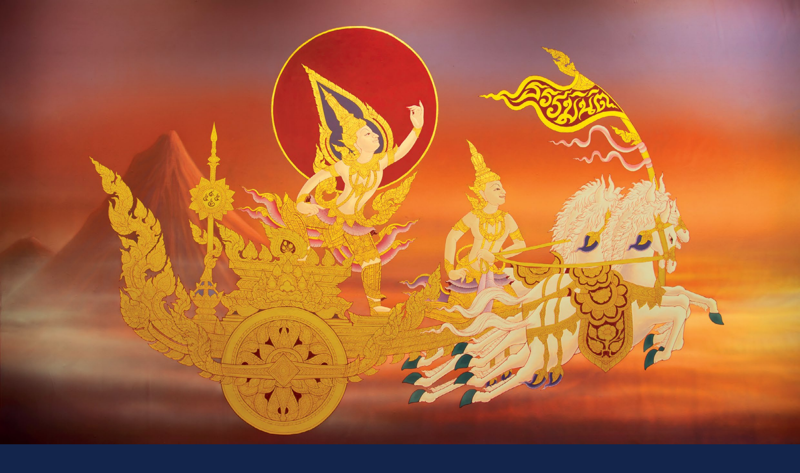
ภาพประดับผนังที่ห้องบุศย์ ชันฉวีทิพย์ : ภาพพระอาทิตย์ทรงราชรถ ขณะข้ามผ่านทิวเขาคุณธรรโดยมีธรรมนิติเป็นธงนำ สะท้อนถึงความมุ่งมั่นเรื่อง เที่ยงตรง และเป็นธรรมของ 'ธรรมนิติ' ทั้งยังเป็นนัยว่า ถึงธรรมนิติจะดำเนินการมาแล้วกว่า 78 ปี ทว่าธรรมนิติก็ยังอยู่ในช่วงแห่งอรุณรุ่งที่เพิ่งเป็นการเริ่มต้นเท่านั้น

จากสำนักงานทนายความเติบโตสู่ “กลุ่มบริษัทธรรมนิติ” ที่มีบริษัทในเครือกว่า 10 บริษัท มีบริการครบวงจร ทั้งด้านกฎหมาย บัญชี ตรวจสอบบัญชี ตรวจสอบภายใน อบรมสัมมนา สื่อสิ่งพิมพ์ และบริการด้านสารสนเทศ ด้วยการนำพา จากผู้นำของธรรมนิติ ที่มีวิสัยทัศน์และยึดมั่นในวิถีแห่งธรรม ธรรมนิติจึงได้เดินทางมาครบ 78 ปี ในปี พ.ศ. 2568 และมุ่งหวัง ตั้งใจจะเดินหน้าสู่ธรรมนิติ 100 ปีต่อไป